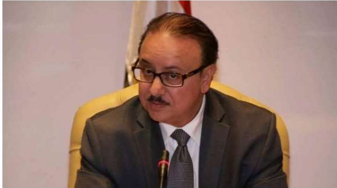
ياسر القاضي وزير الاتصالات