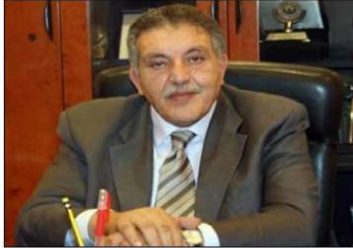
أحمد الوكيل - رئيس الإتحاد للغرف التجارية المصرية