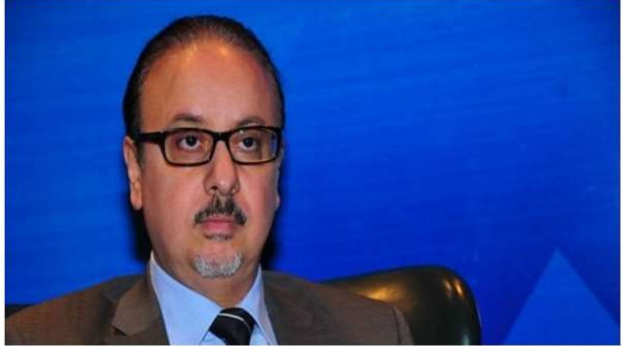
كتب - إبراهيم احمد

شهد اليوم المهندس ياسر القاضي وزير الاتصالات وتكنولوجيا المعلومات، أحمد الوكيل رئيس الاتحاد العام للغرف التجارية مراسم توقيع مذكرة تفاهم بين الاتحاد وشركة فيزا العالمية، والتي يهدف من خلالها الاتحاد الى توسيع رقعة قبول المدفوعات الالكترونية بين التجار والشركات الصغيرة والمتوسطة تماشيا مع الاستراتيجية