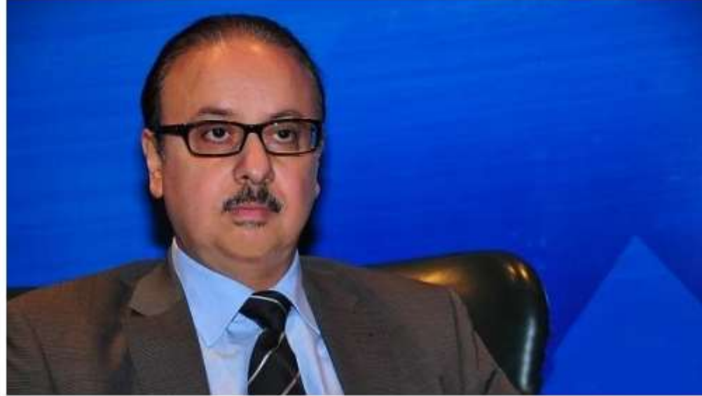
المهندس ياسر القاضي، وزير الاتصالات